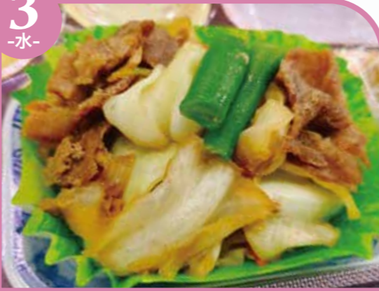
豚肉と野菜の炒め