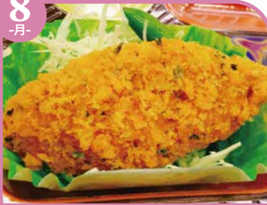
白身魚の青のりフライ