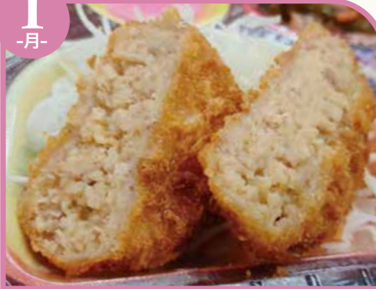
チーズメンチカツ