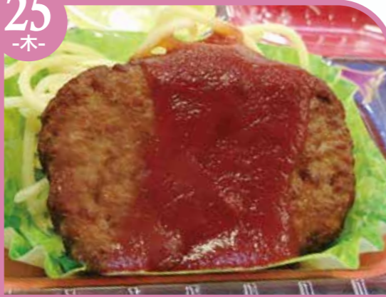
ハンバーグ トマトソース