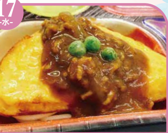
オムレツカレーソース