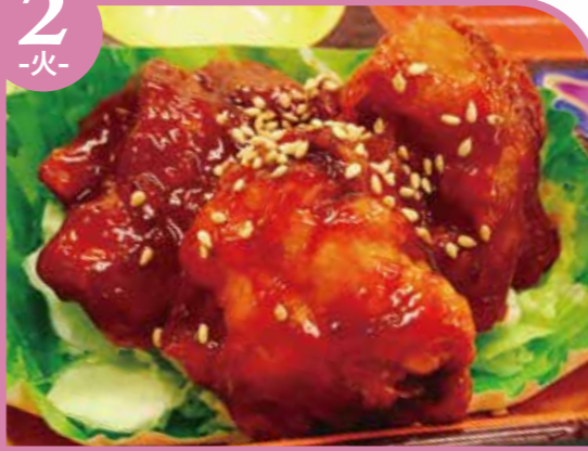
ヤンニョムチキン