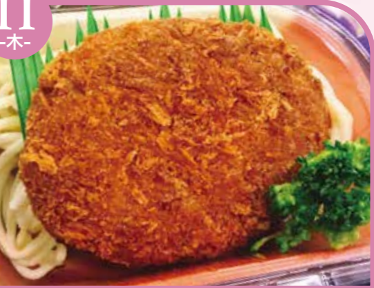
カレールーフライ