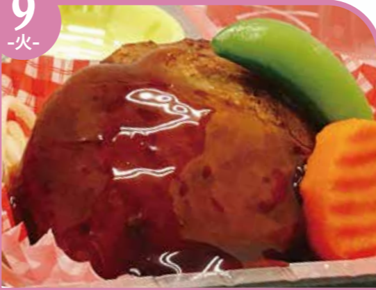
照り焼きハンバーグ