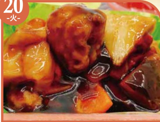
肉団子の甘酢あん