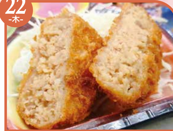
チーズメンチカツ