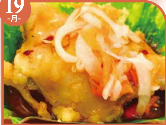
白身魚の南蛮漬け