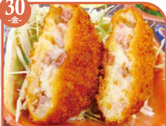
ベーコンマヨカツ