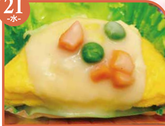
オムレツ ホワイトソースかけ